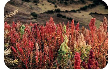
Hay semillas de quinua de distintos colores.