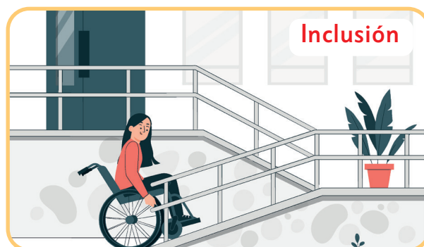
Déficit de personas + Disminución de barreras

¿Sabías que 1 de cada 5 adultos en Chile tiene algún tipo de discapacidad?