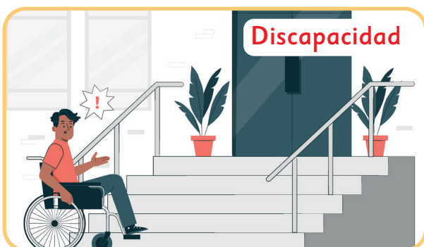
Déficit de personas + Barreras del entorno

La discapacidad no es una característica de la persona, sino que es el resultado de la interacción entre los déficits de la persona y las barreras físicas o actitudinales de su entorno. Por ejemplo, una persona sorda sin la posibilidad de acceder a la lengua de señas al realizar un trámite presenta una discapacidad.