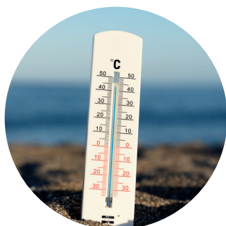
Termómetro de mercurio