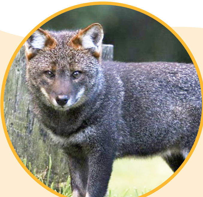
Zorro de Darwin o chilote