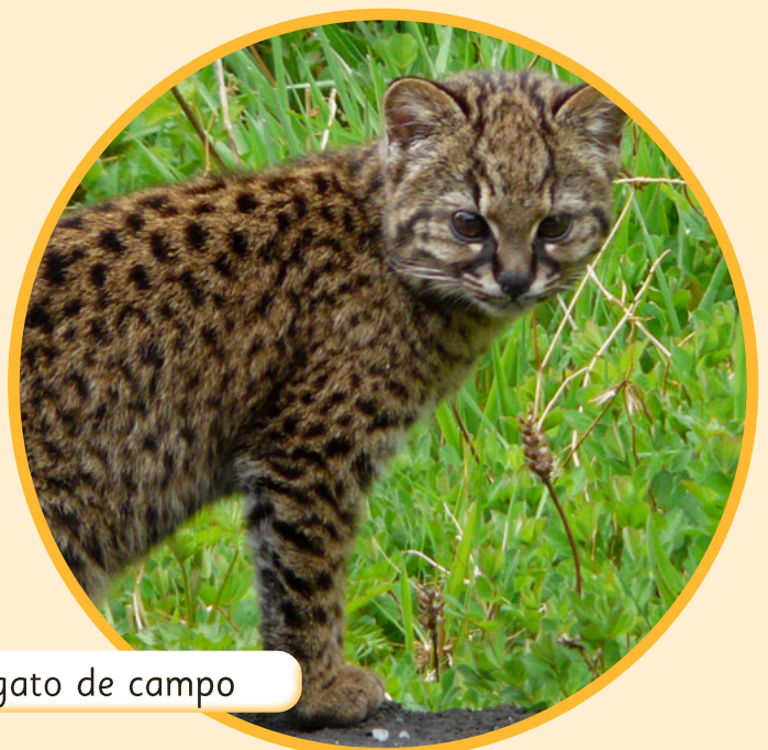
Güiña o gato de campo