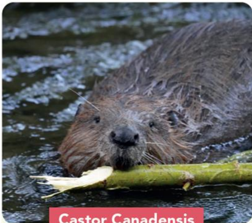
Castor Canadensis Roedor Semiacuático